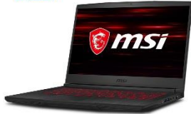
Intel® Core™ i7 Prozessor der 9. Generation *optional