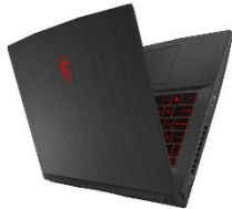
Grafik der NVIDIA® GeForce RTX™ 20 Serie Bis zu 45% schneller!