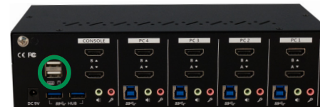
62654I – Rückansicht