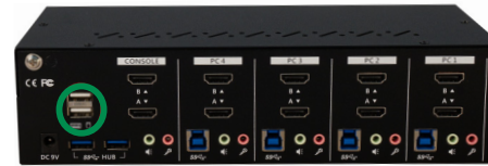
62654I – Rear View