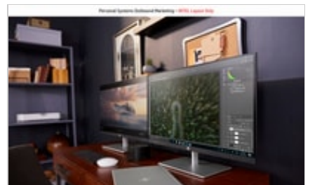
19C1 - HP ENVY 17-inch Laptop PC and - HP Pavilion 27-inches Quantum Dot Display - Omni Lifestyle