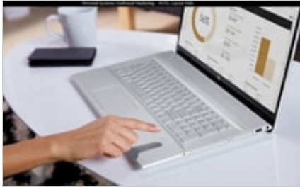
19C1 - HP ENVY 17-inch Laptop PC