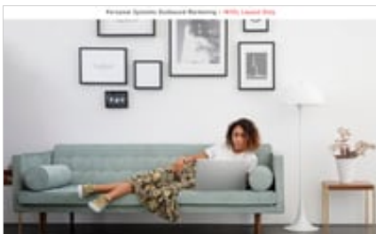
19C1 - HP ENVY 17-inch Laptop PC (17, NT, Natural Silver) Woman using product