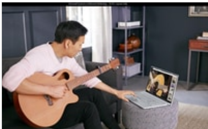
19C1 - HP ENVY 17-inch Laptop PC