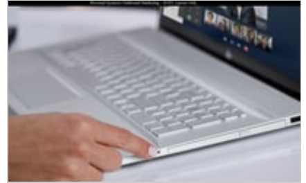
19C1 - HP ENVY 17-inch Laptop PC