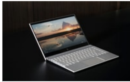
18 C1 Wave 2 - HP ENVY