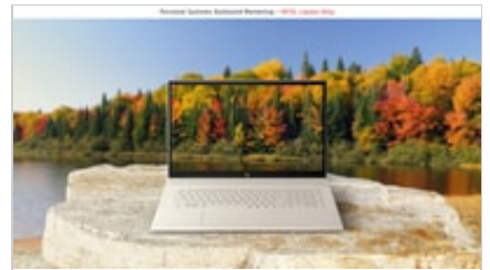
19C1 - HP ENVY 17-inch Laptop PC (17, NT, Natural Silver) showing narrow bezel