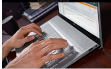
19C1 - HP ENVY 17-inch Laptop PC