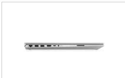
Right profile closed