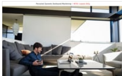
19C1 - HP ENVY 17-inch Laptop PC (17, NT, Natural Silver) Man watching video