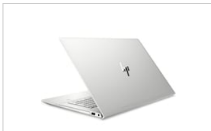
Left rear facing