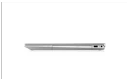
Left profile closed