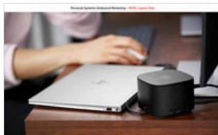
19C1 - HP ENVY 17-inch Laptop PC and - HP Pavilion 27-inches Quantum Dot Display - Omni Lifestyle