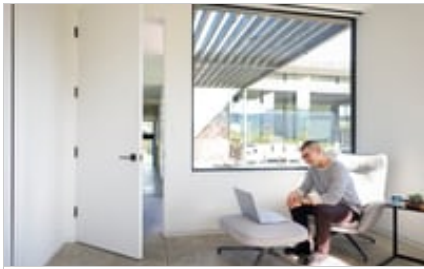
18 C1 Wave 2 - HP ENVY