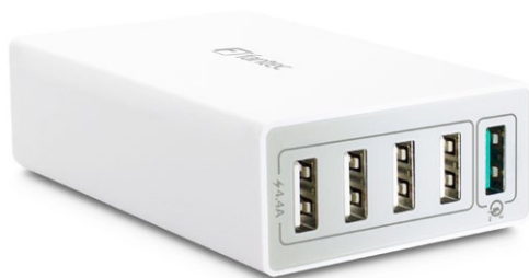
5x USB 40W QC3-A51 (Art.:1954) 1x Quick Charge 3.0 USB (3A) 4x USB (4,4A | max 2,4A je USB Port)