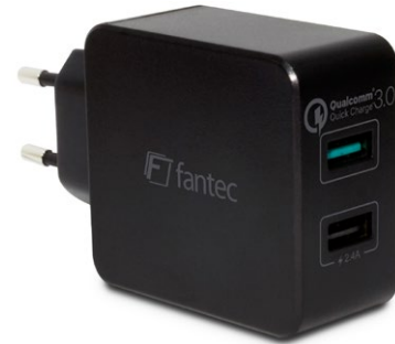
2x USB 30W QC3-A21 (Art.:1950) 1x Quick Charge 3.0 USB (3A) 1x USB (2,4A)