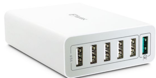
6x USB 60W QC3-A61 (Art.:1955) 1x Quick Charge 3.0 USB (3A) 5x USB (8A | max 2,4A je USB Port)