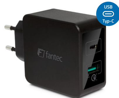
2x USB 33W QC3-AC22 (Art.:1952) 1x Quick Charge 3.0 USB (3A) 1x USB Typ-C (3A)