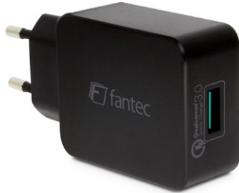
1x USB 18W QC3-A11 (Art.:1948) 1x Quick Charge 3.0 USB (3A)