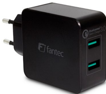
2x USB 36W QC3-A22 (Art.:1951) 2x Quick Charge 3.0 USB (3A)