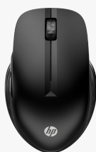
HP 430 Wireless-Maus für mehrere Geräte 3B4Q2AA