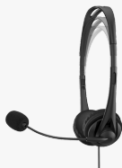
HP Stereo-Headset (3,5 mm) G2 428H6AA