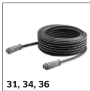
31, 34, 36