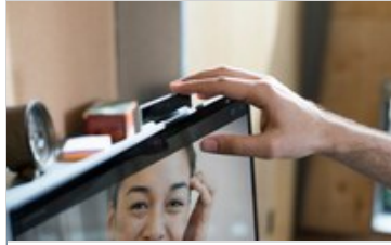
3c17 HP Pavilion AiO