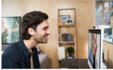
3C17 - HP Pavilion AiO Home Desktop