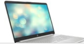
Nach rechts zeigend

54 x 41 (jpg) 54 x 41 (png) 100 x 70 (jpg) 96 x 72 (jpg) 96 x 72 (png) 99 x 74 (png) 153 x 115 (png) 180 x 135 (png) 240 x 180 (jpg) 240 x 180 (png) 247 x 185 (png) 170 x 190 (jpg) 257 x 193 (png) 320 x 240 (jpg) 320 x 240 (png) 474 x 356 (png) 513 x 385 (png) 400 x 400 (jpg) 400 x 400 (png) 573 x 430 (png) 800 x 600 (png) 1659 x 1246 (png) 1500 x 1356 (jpg) 3099 x 1946 (png) 3101 x 2033 (jpg)