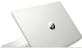
Nach links hinten zeigend

54 x 41 (jpg) 54 x 41 (png) 100 x 70 (jpg) 96 x 72 (jpg) 96 x 72 (png) 99 x 74 (png) 153 x 115 (png) 180 x 135 (png) 240 x 180 (jpg) 240 x 180 (png) 247 x 185 (png) 170 x 190 (jpg) 257 x 193 (png) 320 x 240 (jpg) 320 x 240 (png) 474 x 356 (png) 513 x 385 (png) 400 x 400 (jpg) 400 x 400 (png) 573 x 430 (png) 800 x 600 (png) 1659 x 1246 (png) 1500 x 1359 (jpg) 3094 x 1955 (png) 3094 x 2043 (jpg)