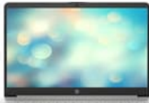
Zur Mitte zeigend

54 x 41 (jpg) 54 x 41 (png) 100 x 70 (jpg) 96 x 72 (jpg) 96 x 72 (png) 99 x 74 (png) 153 x 115 (png) 180 x 135 (png) 240 x 180 (jpg) 240 x 180 (png) 247 x 185 (png) 170 x 190 (jpg) 257 x 193 (png) 320 x 240 (jpg) 320 x 240 (png) 474 x 356 (png) 513 x 385 (png) 400 x 400 (jpg) 400 x 400 (png) 573 x 430 (png) 800 x 600 (png) 1659 x 1246 (png) 1500 x 1449 (jpg) 2909 x 1945 (png) 2906 x 2012 (jpg)