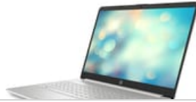
Nach links zeigend

54 x 41 (jpg) 54 x 41 (png) 100 x 70 (jpg) 96 x 72 (jpg) 96 x 72 (png) 99 x 74 (png) 153 x 115 (png) 180 x 135 (png) 240 x 180 (jpg) 240 x 180 (png) 247 x 185 (png) 170 x 190 (jpg) 257 x 193 (png) 320 x 240 (jpg) 320 x 240 (png) 474 x 356 (png) 513 x 385 (png) 400 x 400 (jpg) 400 x 400 (png) 573 x 430 (png) 800 x 600 (png) 1659 x 1246 (png) 1500 x 1449 (jpg) 2909 x 1945 (png) 2906 x 2012 (jpg)