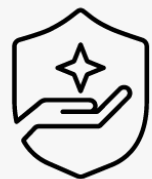
3 Jahre Abhol- und Rückgabesevice U4819E