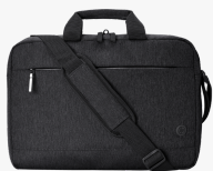
HP Prelude Pro 17.3 Zoll Laptop-Tasche 3E2P1AA