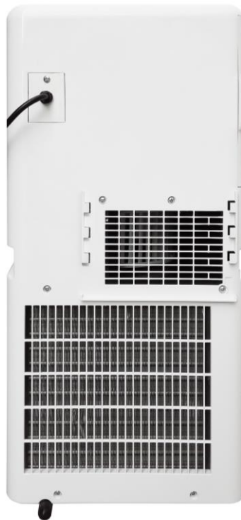
Kondenswasser Abfluss Pfropfen