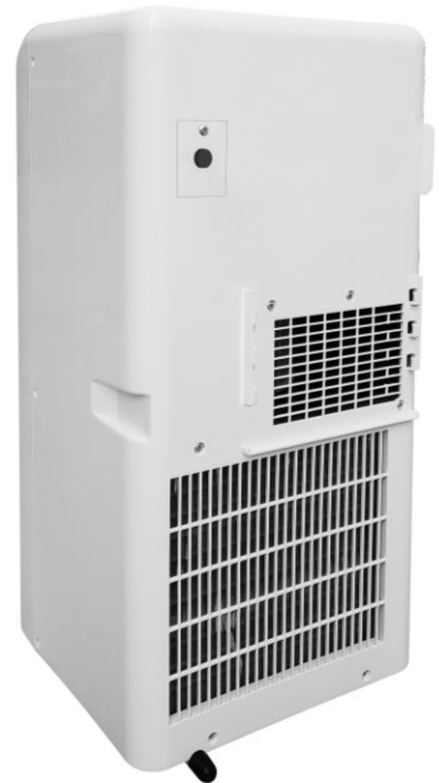
Abluftschlauchanschluss 150 mm Schlauchdurchmesser