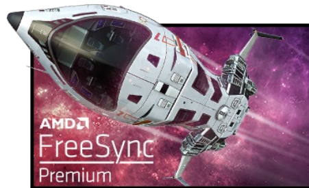
Technologia FreeSync™ Premium

Matryca Fast IPS nie tylko gwarantuje wierne odwzorowanie scen z pola bitwy i wyjątkową dokładność kolorów, ale także niesamowity czas reakcji na ruchomy obraz (MPRT) wynoszący 0.8 ms.