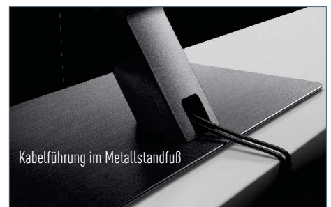
Kabelführung im Metallstandfuß

Die neue FXW784-Serie mit Cinema Display und dem neuen Studio Colour HCX Processor verspricht schöne Heimkinoabende. Durch die Kombination des neuen Art & Interior Glass mit dem zeitlosen Metalldesign lässt sich der FXW784 beliebig in Ihr Wohnambiente integrieren. Für den entsprechenden Raumklang sorgt das neue Cinema Surround Sound Pro Soundsystem. Dank Quattro Tuner mit Twin-Konzept und TV>IP genießen Sie den höchsten Komfort und optimale Flexibilität beim Empfang.