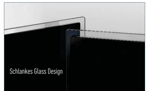
Schlankes Glass Design