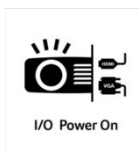
I/O Power On

Mit der HDMI Power On Funktion ist der Projektor in der Lage sich automatisch einzuschalten, sobald der Projektor ein Signal per HDMI oder VGA zugespielt bekommt. Sie brauchen den Projektor nicht mehr separat zu starten, sondern können einfach ihr Notebook, ihren Receiver oder die Spielekonsole einschalten und der Projektor schaltet sich automatisch ebenfalls ein.