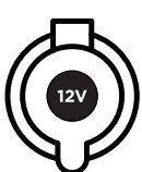
12V DC Zigarettenanzünder