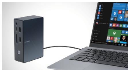
SimPro Dock's erweiterbar