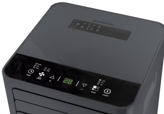
Einlagefach für die Fernbedienung

Neben der Abkühlung der Luft unterscheidet sich das Klimagerät von herkömmlichen Ventilatoren dadurch, dass die abgekühlte Luft auch entfeuchtet und gereinigt wird. Dadurch verbessert sich das Raumklima um zwei weitere, für das Wohlbefinden relevante Parameter.