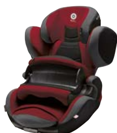
SAO PAULO 41-543-PF-049