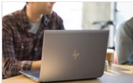
HP ZBook 15 G5 Mobile Workstation