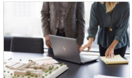
HP ZBook 15 G5 Mobile Workstation