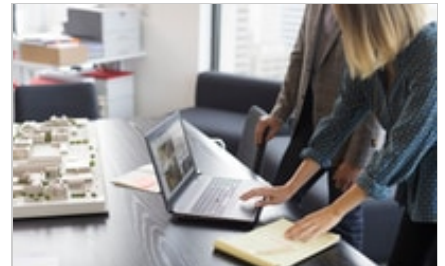
HP ZBook 15 G5 Mobile Workstation