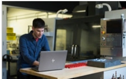
HP ZBook 15 G5 Mobile Workstation