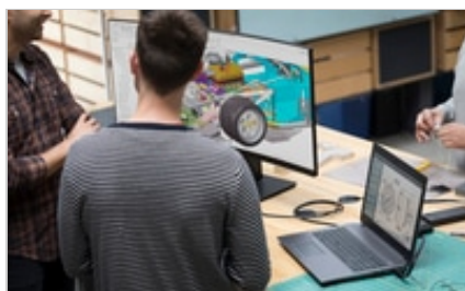
HP ZBook 15 G5 Mobile Workstation, HP Z38c 37.5-inch Curved Display