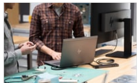
HP ZBook 15 G5 Mobile Workstation, HP Z38c 37.5-inch Curved Display, HP Thunderbolt 3 Dock