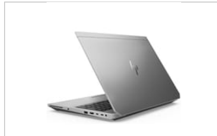
Left rear facing