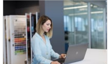
HP ZBook 15 G5 Mobile Workstation