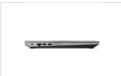
Right profile closed