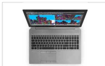
Top view open