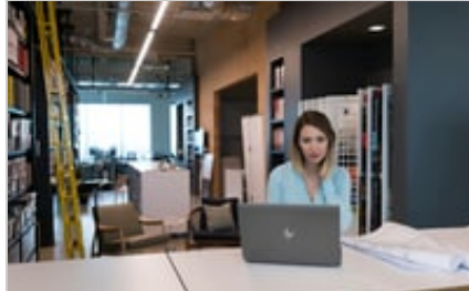
HP ZBook 15 G5 Mobile Workstation