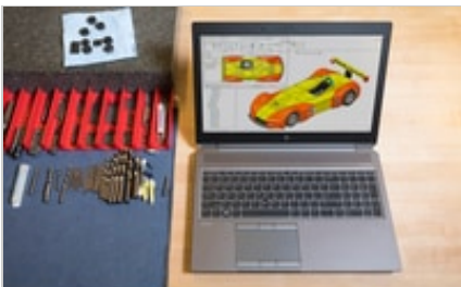
HP ZBook 15 G5 Mobile Workstation