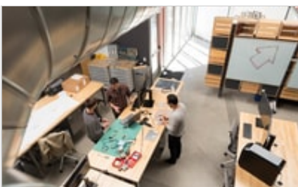
HP ZBook 15 G5 Mobile Workstation, HP Z27 27-inch 4K UHD Display, HP Z24n G2 24-inch Display, HP Thu