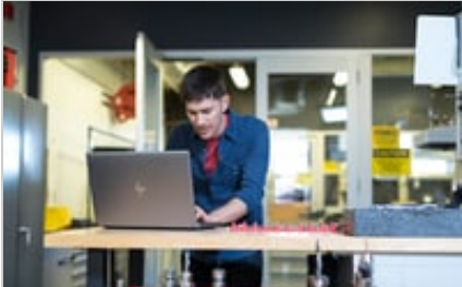
HP ZBook 15 G5 Mobile Workstation