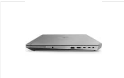
Left profile closed