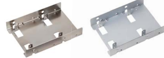
SDP08 / SDP08-LITE Bay Converter für 3,5 in 2,5 Zoll