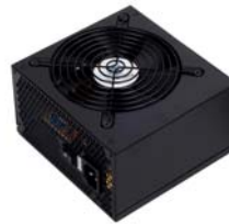
ST40F-ES 400 W-Netzteil, hochwertig und bezahlbar