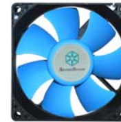
SST-SUSCOOL81 Statten Sie Ihren PS09 zur ultimativen Kombination aus Geräuscharmheit und Leistung mit S uscool 81 aus.