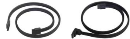
CP07+CP08 Die SATA III-Kabel CP07+CP08 eignen sich ideal für alle herkömmlichen SATA-Geräte.