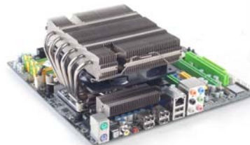
NT06-PRO Der ultimative Kühlkörper mit hoher Flexibilität bei nahezu allen.