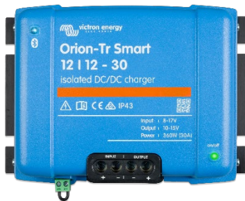
Orion-Tr Smart 12/12-30