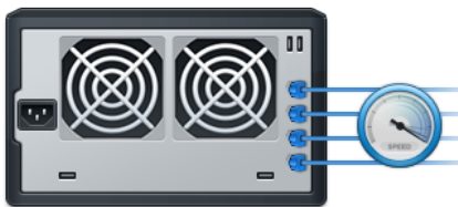
Abbildung 2) Herausragende Leistung

Synology High Availability stellt bei Ausfall eines Servers den nahtlosen Wechsel zwischen zwei Cluster-Servern mit minimalen Auswirkungen auf Unternehmen sicher.