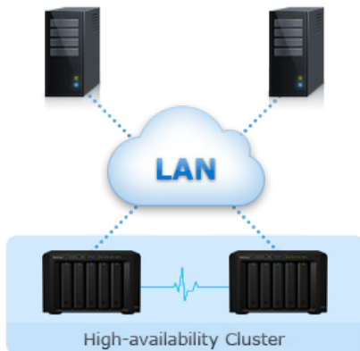
Abbildung 1) Zuverlässigkeit, Verfügbarkeit & Disaster Recovery

Synology High Availability stellt bei Ausfall eines Servers den nahtlosen Wechsel zwischen zwei Cluster-Servern mit minimalen Auswirkungen auf Unternehmen sicher.