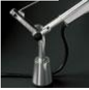
TOLOMEO SUPP.TAVOLO FISSO A004200