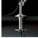
TOLOMEO MORSETTO A004100