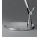
TOLOMEO BASE D 200 ALL A008600