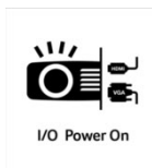
I/O Power On

Mit der HDMI Power On Funktion ist der Projektor in der Lage sich automatisch einzuschalten, sobald der Projektor ein Signal per HDMI oder VGA zugespielt bekommt. Sie brauchen den Projektor nicht mehr separat zu starten, sondern können einfach ihr Notebook, ihren Receiver oder die Spielekonsole einschalten und der Projektor schaltet sich automatisch ebenfalls ein.