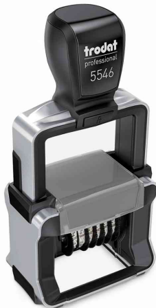
Ziffernstempel Professional 4.0 5546

Zubehör: Ersatzstempelkissen: auf Blisterkarte, Abgabe nur in ganzen VE's