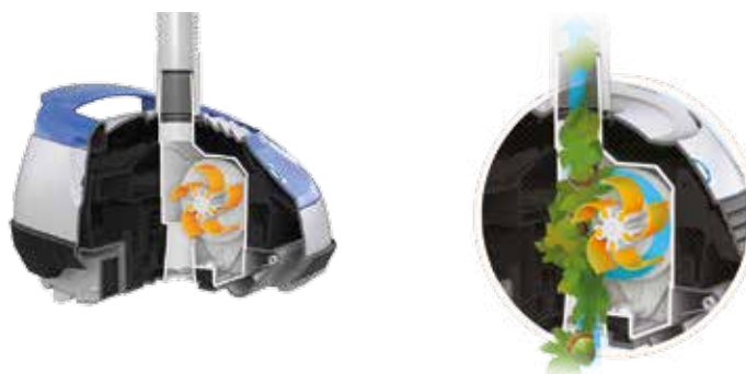
Patentierte Technologie V Flex™: Turbine mit flexiblen Turbinenblätter für die Aufnahme großer Verunreinigungen

Das Design der Turbinenblätter ermöglicht eine bessere Ansaugung aller Arten von Verunreinigungen.