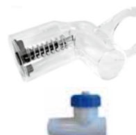
Unterdruckmesser und Regelventil