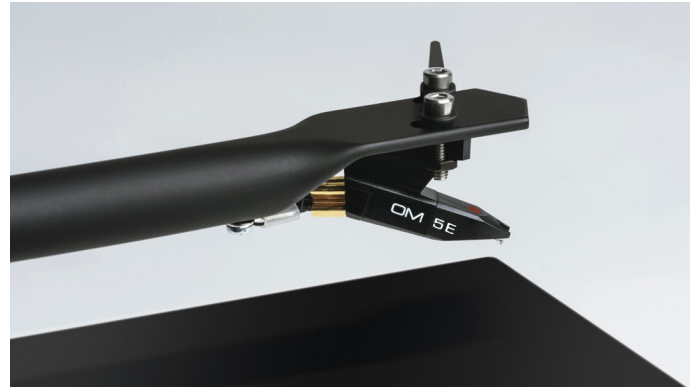
Hochqualitativer Ortofon OM 5E MM Tonabnehmer mit elliptischem Stylus

Der T1 BT ist der neue Shooting Star unter den leistbaren Bluetooth-Plattenspielern. Die Fertigung in Europa erfolgt in einem Werk mit jahrzehntelanger Tradition im Plattenspielerbau. Genau das macht den T1 BT zu einem echten HiFi Plattenspieler, der klanglich sowie optisch überzeugt. Der eingebaute Phono-Preamp und Bluetooth-Streaming erleichtern es zusätzlich, diesen Plattenspieler in viele Wohnzimmeranlagen zu integrieren.