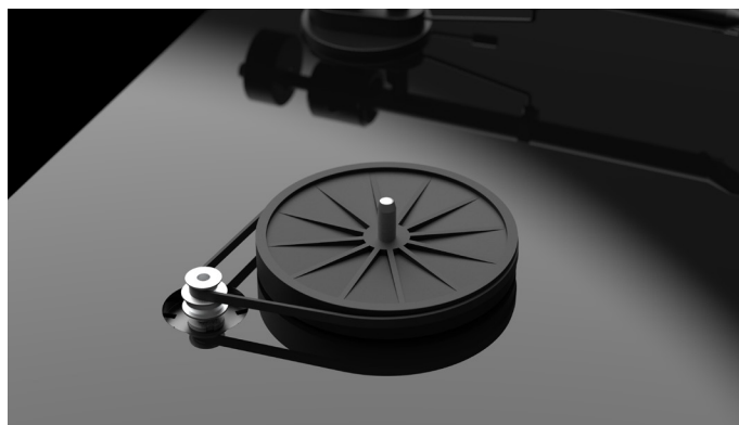
Besonders präzise Motor- und Subteller-Konstruktion

Der T1 BT verfügt über unsere bewährte DC/AC Motorsteuerung. Der Plattenteller wird per Riemen angetrieben. Dieser überträgt präzise die Antriebskraft auf den neu designten Subteller, welcher wiederum in dem ultra-präzisen 0,001mm Plattentellerlager mit einem gehärtetem Edstahlschaft in einer Messingbuchse sitzt.