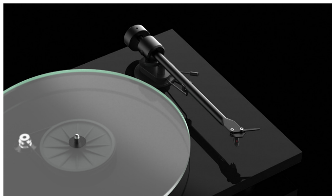
Einteiliger Aluminiumtonarm Robuste und steife Konstruktion für glasklaren Sound

So kann der T1 BT ein stabil und gleichlaufend rotierendes Plattenteller, das die Basis für eine unverfälschte Abtastung durch Tonarm und Tonabnehmer darstellt, garantieren.