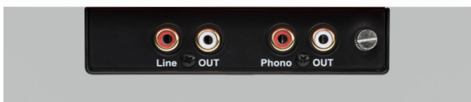
Separater Line und Phono Ausgang Ein/Ausschaltbarer Bluetooth-Sender (nicht abgebildet)

Das stylische, CNC gefräste Chassis, in Hochglanz Schwarz, matt Weiß & Walnuss erhältlich, enthält keinerlei Plastikteile und wird gänzlich ohne Hohlräume gefertigt, sodass keine unerwünschten Vibrationen im Chassis auftreten können.