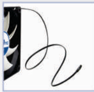
40 cm Kabel mit Temperatursensor