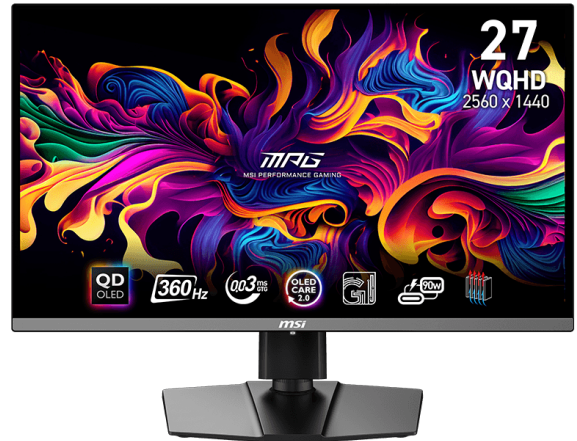
Picture and logos

Visualisiere deinen Sieg mit dem MPG 271QRX QD-OLED Gaming-Monitor. Das 2560 x 1440 (WQHD) QD-OLED-Panel bietet eine Bildwiederholrate von 360 Hz und eine schnelle Reaktionszeit von 0,03 ms (GtG). Die VESA-Zertifizierung für ClearMR 13000 und DisplayHDR True Black 400 sorgt für außergewöhnlich lebendige Bilder und reduziert Bewegungsunschärfen. OLED Care 2.0 reduziert das Risiko des Einbrennen. Für Konsolenspieler bietet der MPG 271QRX QD-OLED einen HDMI 2.1 Anschluss mit 48Gbps Bandbreite, 120Hz, VRR und ALLM Unterstützung.